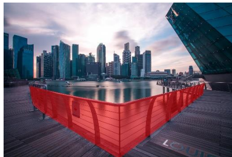
電子圍籬智慧監控