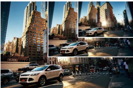
FULL HD 超高畫質