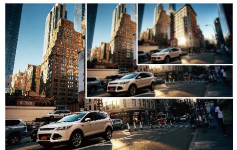
1080 FULL HD