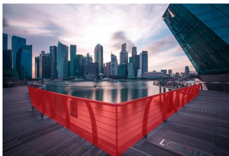
電子圍籬智慧監控