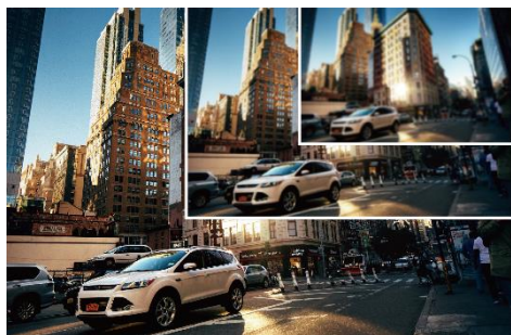
FULL HD 超高畫質